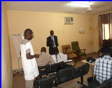
Atelier de formation des Elus